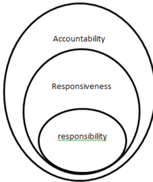
نمودار ۲: موقعیت مفاهیم مجاور با مفهوم پاسخگویی